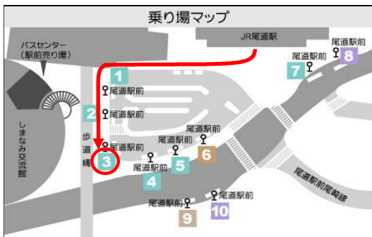
尾道駅前・南口3番のりば